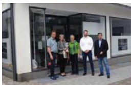
Citymanager in neuen Räumen