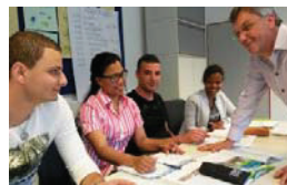
Neues VHS-Programm für Oberberg

JOHANN WOLFGANG VON GOETHE: "Man muß das Wahre immer wiederholen, weil auch der Irrtum um uns immer wieder gepredigt wird, und zwar nicht von Einzelnen, sondern von der Masse in Zeitungen und Enzyklopädien, auf Schulen und Universitäten."